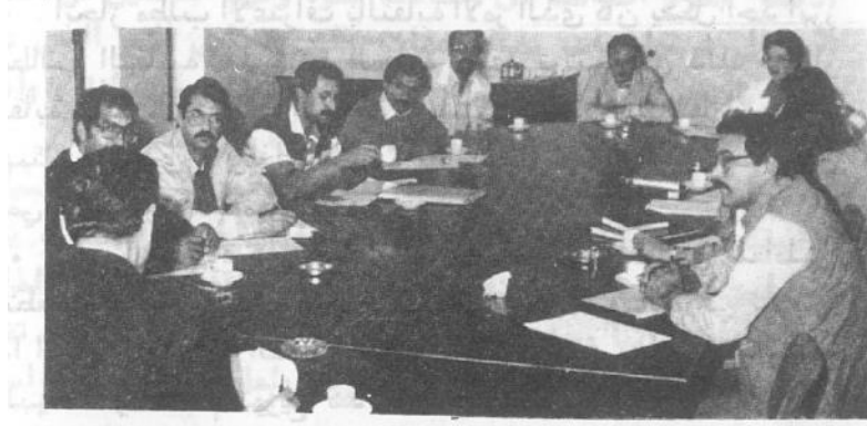
احد اجتماعات التفاوض بشأن مطالب العاملين بين ادارة الجامعة والهيئة الادارية للنقابة